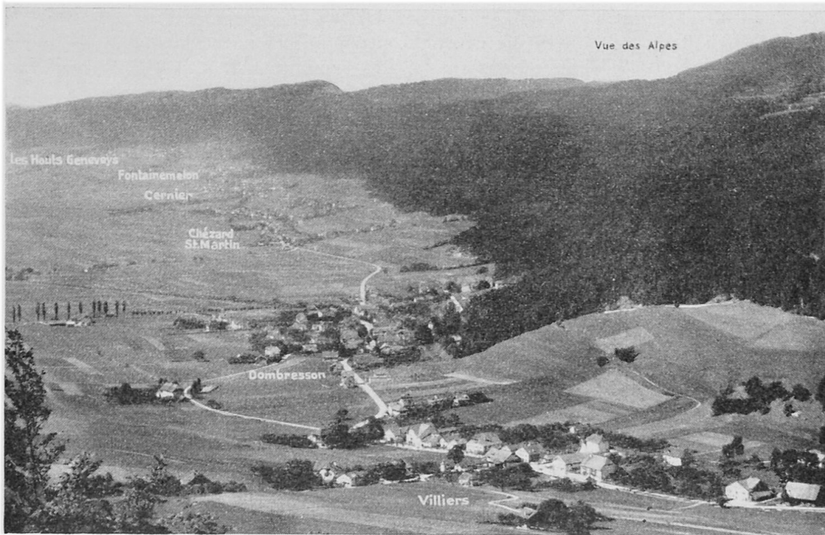
Val de Ruz: Blick vom Ostende des Tales gegen Westen, über die Dörfer des nördlichen Talrandes.

nachbarten Hoch-Comben und -Rücken bis an die harte Sequankante, welche erst zum endgültigen Abstieg überleitet in Richtung Vallée des Ponts einerseits und oberstes Val St-Imier andererseits. Daß diese rückwärtige Kante zugleich zur Bezirks- und Kantonsgrenze geworden ist, unterstreicht ihre Bedeutung. Die Gelände von Grande Sagneule (552/207), Derrière Tête de Ran (555/212), Le Gurnigel (559/215.5), Derrière Pertuis (562/217) und La Joux de Plâne (564/217.5) zählen also zum Val de Ruz. So reicht denn die Mehrzahl der nw des Seyon gelegenen Gemeinden bandartig hangaufwärts, über die Bergschulter und weiter über die Hauptkrete ins orographische Einzugsgebiet der nördlich benachbarten Regionen. Daß die Ausweitung des Besitzes gegen NW geschah ist durchaus verständlich; sie entsprach dem allgemeinen Gang der Besiedlung von den Niederungen in Richtung Hochtäler; hier gab es noch Räume für neue Weiden und Wohnstätten, während die Gegenseite, der Hang des Chaumont, derartige Möglichkeiten gar nicht bot.