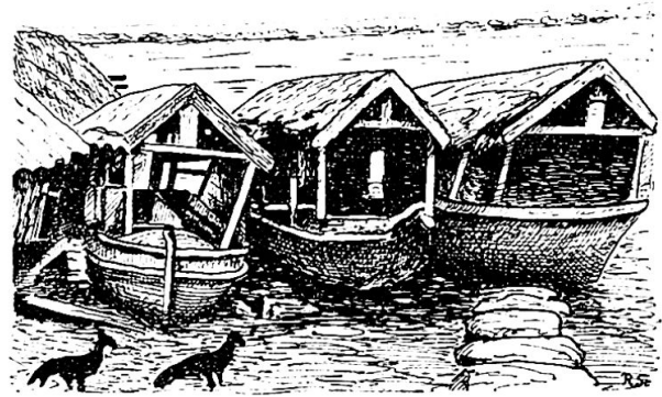
Canoas mit Hüttenaufbau (Batalaõs)