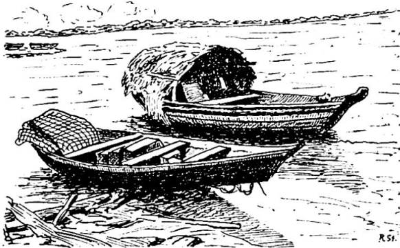
Canoas mit Schutzdach (Igarité)