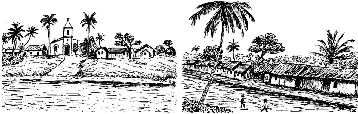
Caoioè, Hauptort im Tal des Rio Negro. Rechts die Hauptstraße