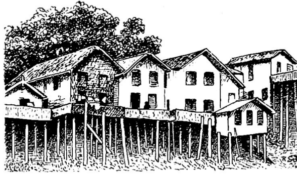
Pfahlbauten im Amazonasgebiet

«Chatas» (Die Flachen). Schließlich nennt man Schiffe, die als ambulante Verkaufsläden von Ort zu Ort gefahren werden «Regatoes» (Krämer). Mit der Verstaatlichung der Schifffahrt und wohl auch wegen dem Rückgang der Konjunktur geriet sie in Verfall. Die Bundesregierung mußte eingreifen. Seit 1955 versehen neue gute Dampfer den Dienst auf den Hauptströmen. In den Außenquartieren der Stadt, wo die Caboclos wohnen, sind verschiedene Schiffstypen im Gebrauch. Die einfache Canoa, genannt «Montaria», für 2 bis 3 Personen ist etwa 5 m lang, ausgehöhlt aus einem weichholzigen Baumstamm, zuweilen an den Seiten überhöht durch Bretter. Boote von 6 bis 8 m Länge heißen «Igarité» und haben hinten ein niederes Dach aus Rundstäben und Palmblättern. «Batalao» heißt das Schiff von 8 bis 10 m Länge, das auf der hintern Hälfte ein Miniaturhaus trägt. Diese Schiffe werden gewöhnlich nicht gerudert, sondern folgen angehängt den motorbetriebenen Chatas. Der Besitzer des Motorschiffes bezieht für den Schlepperdienst Bargeld oder Waren.