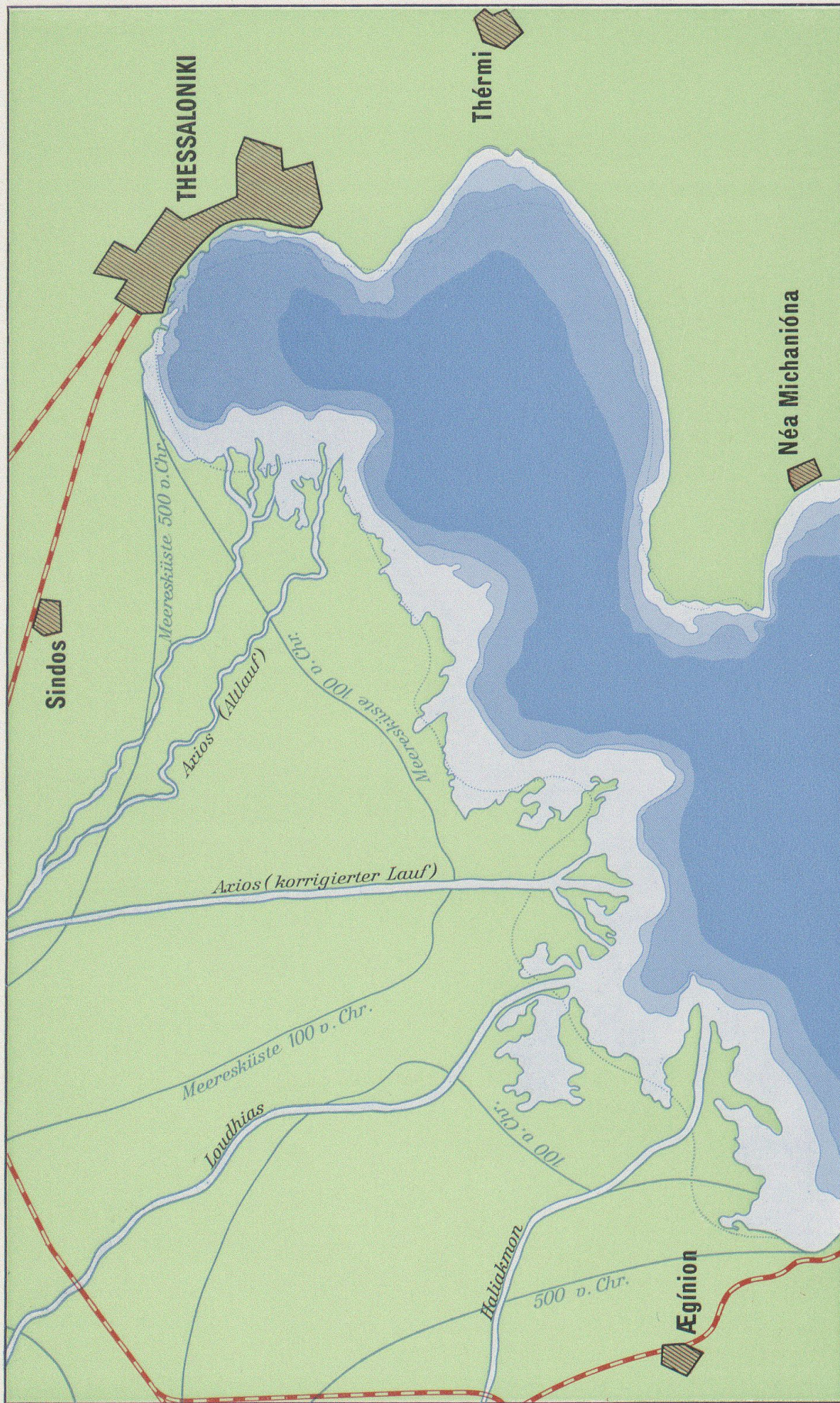
Veränderungen des Golfes von Thessaloniki (Saloniki) in historischer Zeit. Die Isolinien deuten einzelne Verlandungsstadien an