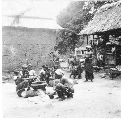
Abb. 1 (links): Gehöfttyp mit getrennten Räumen. Abb. 2 (rechts): Typisches Mehrgebäudegehöft einer Großfamilie. Das Leben spielt sich im Freien ab.

ches Ursprüngliche reliktmäßig erhalten. Auf dem Kroboberg – davon zeugen die wenigen Ruinen – waren die Grundmauern vielfach aus lokalen Steinen aufgebaut. Einige figürliche Darstellungen in der Dachdekoration 3 ausgenommen, findet sich beim Krobohaus kaum ein Ansatz zum Schmuck.