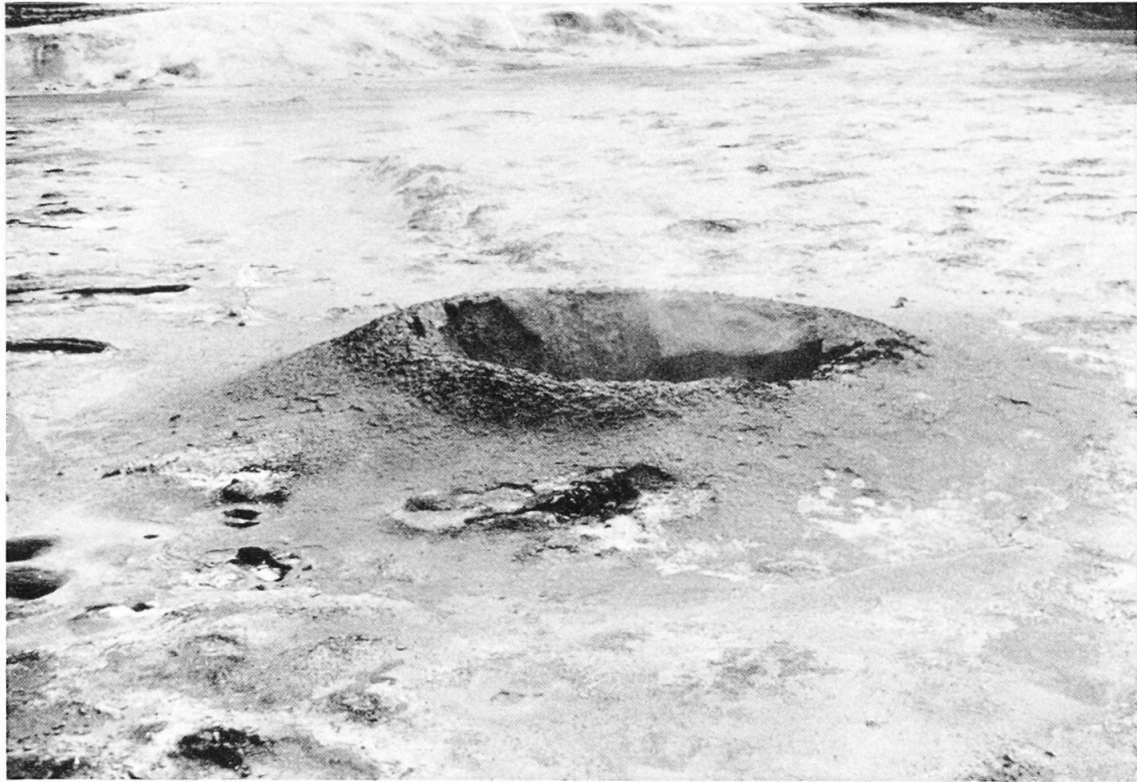
Abb. 2: Grauschwarzer Schlammvulkan; darum herum poröser weißlicher Boden.