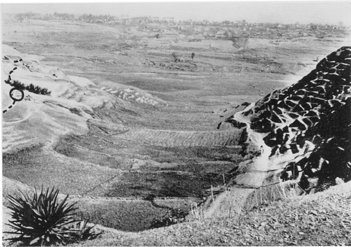
Figur 3 Kleines Seitental des Nakhu Khola, südlich Jawalakhel-Katmandu. Siehe Beschreibung im Text. Aufnahme: HB 4.3.64

die aber hier besonders eindrücklich beobachtet werden kann. Um 16.00 wurde unterhalb des Passes von Manga-Deorali angehalten.