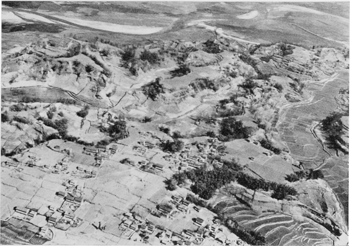
Figur 4 Flugaufnahme eines Dorfes im Valley, östlich von Katmandu. Die geologisch-morphologische Situation ist dieselbe wie in Figur 3; die Landnutzung ist im Text beschrieben. Aufnahme: HB 5.3.64

bablement alluviaux et anciens». Ich möchte beifügen, daß im allgemeinen diese Gerölle, welche einige Dezimeter im Durchmesser erreichen können, eine tief schwarze Verwitterungsrinde besitzen und mich in jeder Beziehung an Produkte arider Verwitterung erinnerten. Leider war eine Probenmitnahme nicht möglich, doch scheint mir hier der Ansatzpunkt für klimamorphologische Untersuchungen in Verbindung mit der Talgenese zu liegen.