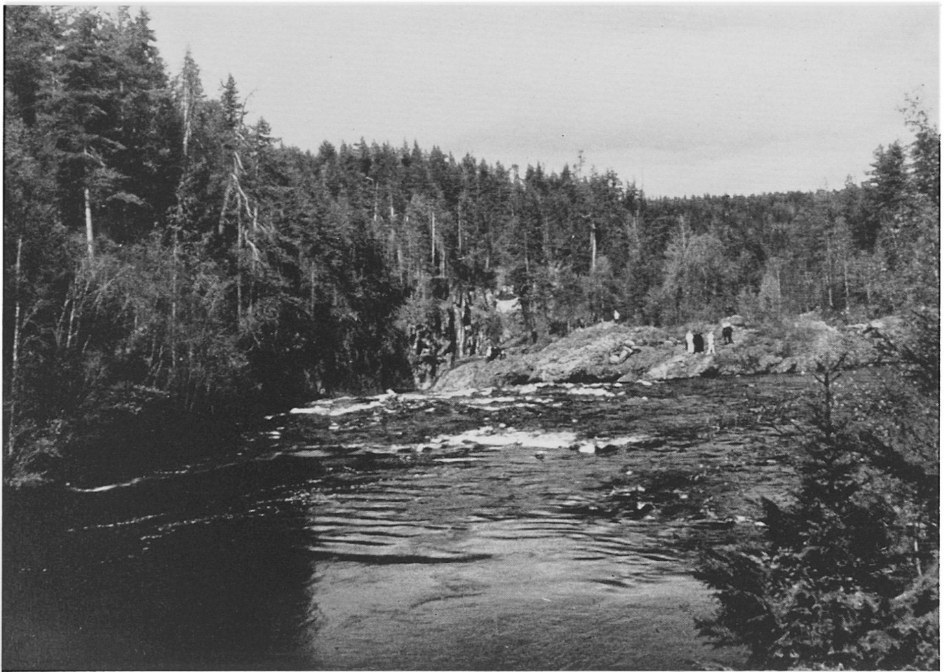
Abbildung 2. Der Fluß Oulankajoki im Nationalpark Oulanka in Kuusamo, Nordostfinnland.

Torf abzubauen und als Brenn- oder Düngemittel zu verwenden.