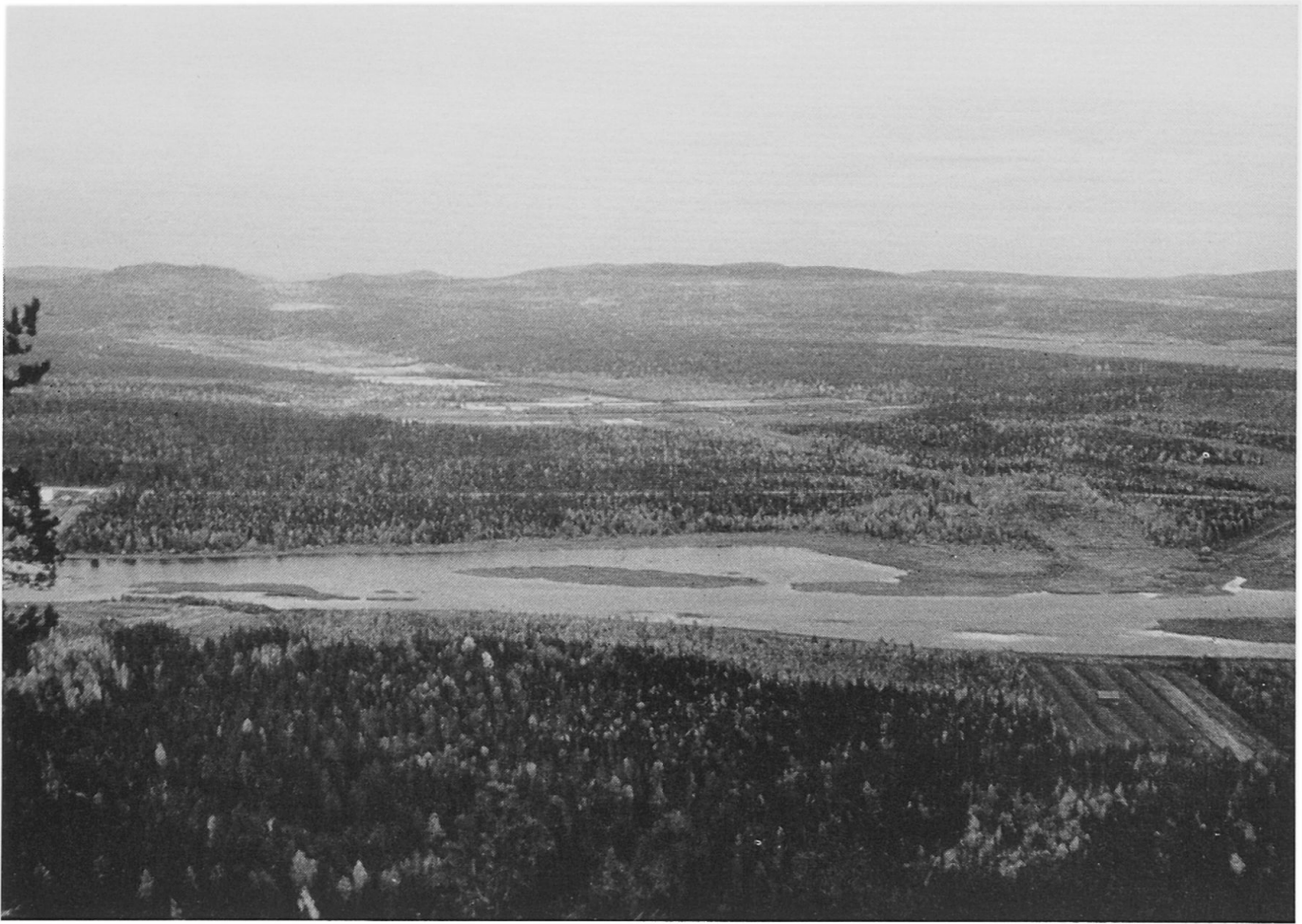
Abbildung 1. Landschaft in Aavasaksa. Wälder, Moore und Flüsse sind die Hauptelemente der Landschaft im südlichen Lappland.

Meeres oder der Seen abgelagert, von wo sie anlässlich der Landhebung über den Wasserspiegel gehoben wurden. Als Ackerböden sind sie jetzt von sehr großer Bedeutung. Lehm- und Sandfelder treten besonders im Küstengebiet des Bottnischen Meerbusens, an den Ufern der großen Seen und längs der Flüsse auf. An den Flußufern liegen auch postglazial entstandene, vom Fluß bei Hochwasser aufgeschüttete Lehm- und Sandfelder.