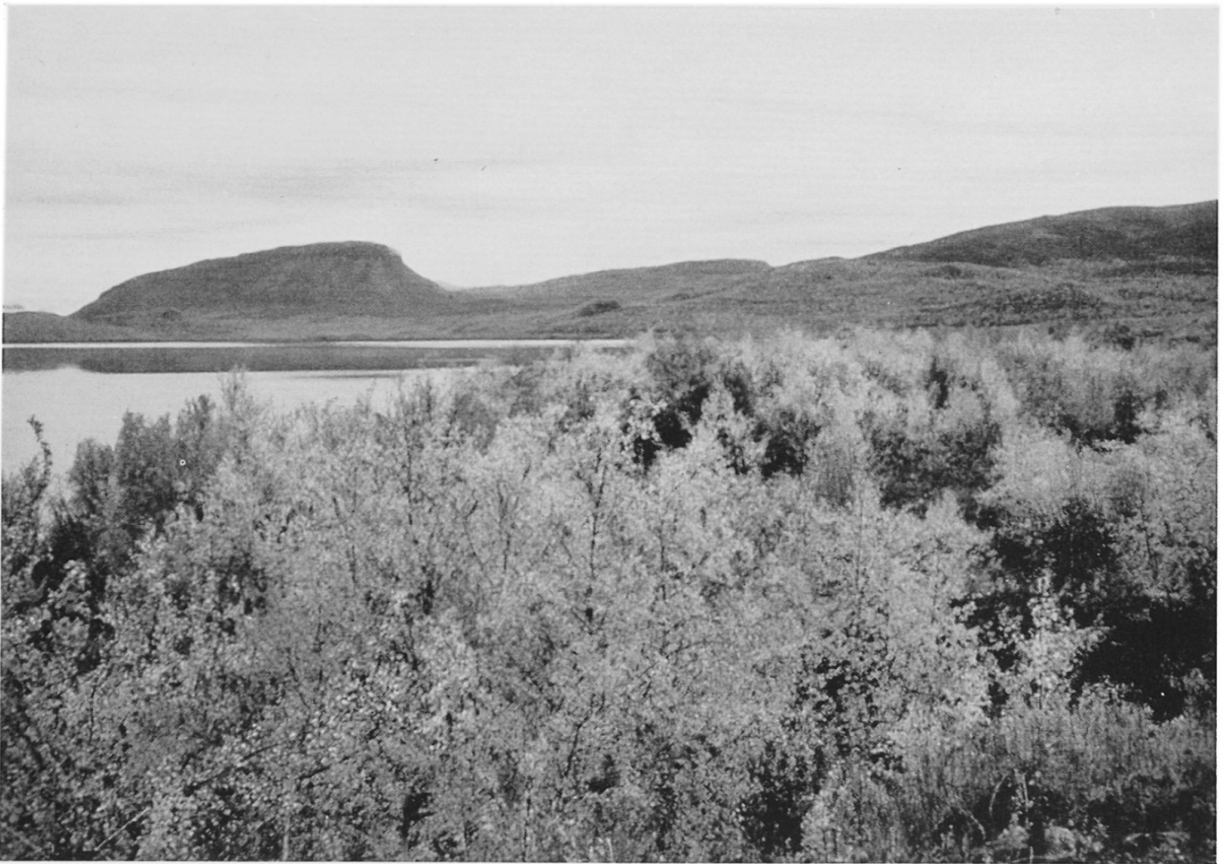
Abbildung 4. Birken-Buschwald in Nordlappland. Im Hintergrund der Saanaberg, 1029 m ü. M.

es eben ist, gibt es hier kaum Einsenkungen, die als Seebecken dienen können. Dazu kommt, daß sich der größte Teil des Gebietes zum Bottnischen Meerbusen neigt und dort keine wasserstauenden Schwelgen vorkommen. Seen und Flüsse sind am spärlichsten im Küstenbereich des Bottnischen Meerbusens und in weiten Regionen Nordlapplands, wo ihr Anteil an der Oberfläche sogar unter 5% liegt. In Kainuu und in Nordostfinnland (Gebiet von Kuusamo) sowie in der Gemeinde Inari in Lappland nehmen die Wasserflächen dagegen stellenweise 15–35% der Gesamtfläche ein. In der Provinz Oulu beträgt der Anteil der Wasserflächen ungefähr 7,8%, in der Provinz Lappland 5,6%, in ganz Finnland sogar 10,3% der Oberfläche.