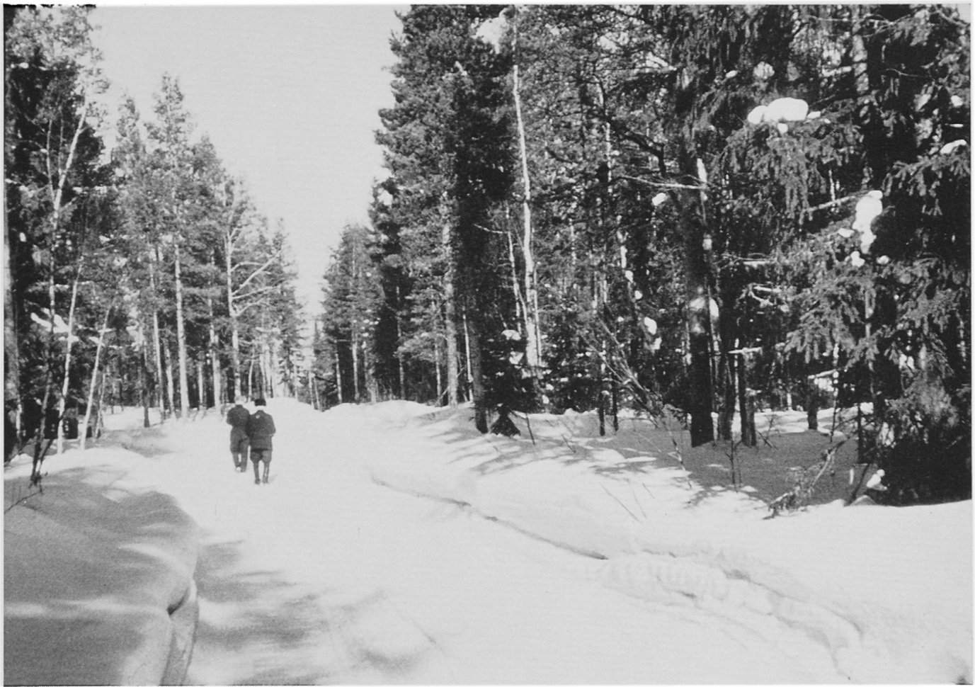
Abbildung 5. Mischwald in Oulainen, im südlichen Teil Nordfinnlands.

Meerbusens. In dessen Nordteil ist das Wasser nur noch schwach salzhaltig; der Salzgehalt beträgt ungefähr 3 Promille. Für die Schifffahrt Nordfinnlands hat der Bottnische Meerbusen große Bedeutung; Oulu, Kemi und Raahen sind wichtige Hafenstädte. Zwar ist sein Nordteil im Winter ein halbes Jahr lang zugefroren, die Schifffahrt kann jedoch mit Hilfe von Eisbrechern zeitweise aufrechterhalten werden.