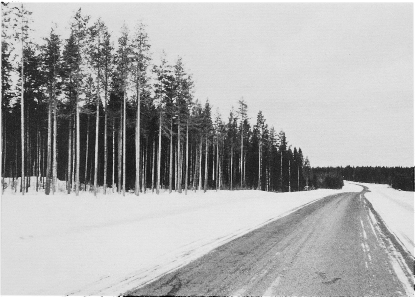
Abbildung 6. Straße zwischen Oulainen und Ylivieska. Die Straßen sind auch in Nordfinnland ziemlich gut.

Nicht ganz Nordfinnland wird jedoch von Wald bedeckt; weite Flächen werden von Mooren eingenommen. Die Grenze zwischen Sümpfen und Wäldern ist nicht immer klar zu erkennen; in manchen Zonen, die eigentlich zu den Sümpfen gezählt werden, wachsen so zahlreiche Bäume, daß sie als Wälder anzusehen sind. Die finnischen Sümpfe werden in drei Haupttypen unterteilt: Sumpfbruchwald (finnisch «korpi»), Reisermoor (finnisch «räme») und offenes, baumloses Moor (finnisch «avosu»). In den Sumpfbruchwäldern wächst ein ziemlich guter Fichten- oder Birkenwald. In den Reisermooren dagegen gedeiht als Holzart am besten die zwergwüchsige Kiefer. Die baumlosen Moore sind, wie schon ihr Name besagt, völlig ohne Baumbewuchs.