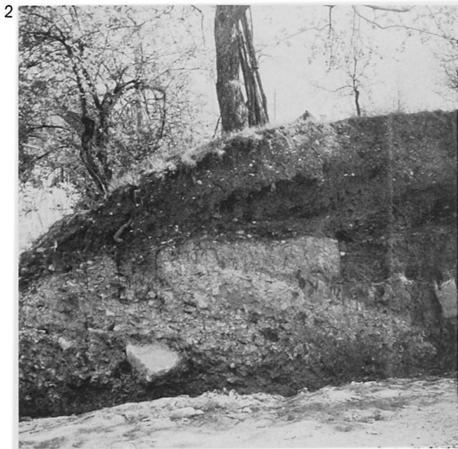
Abb. 2 Osterfingen. Angeschnittenes ebenerdiges sogenanntes «Großhaus» mit zwei Pfostenlöchern (für starke Pfosten). Karolingerzeitlich.