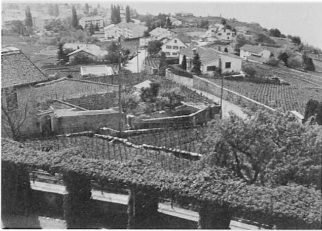
Phase récente d'urbanisation du vignoble de Lavaux entre Cully et Grandvaux.