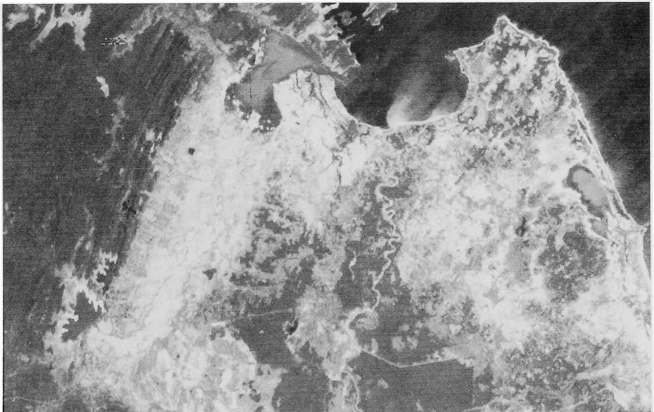
Abb. 2: Landsat-Bild (Kanal 5) vom 3. 10. 79 des gleichen Ausschnittes wie in Abb. 1. Gut erkennbar ist das Ausmaß der Waldrodungen in den 6½ Jahren.