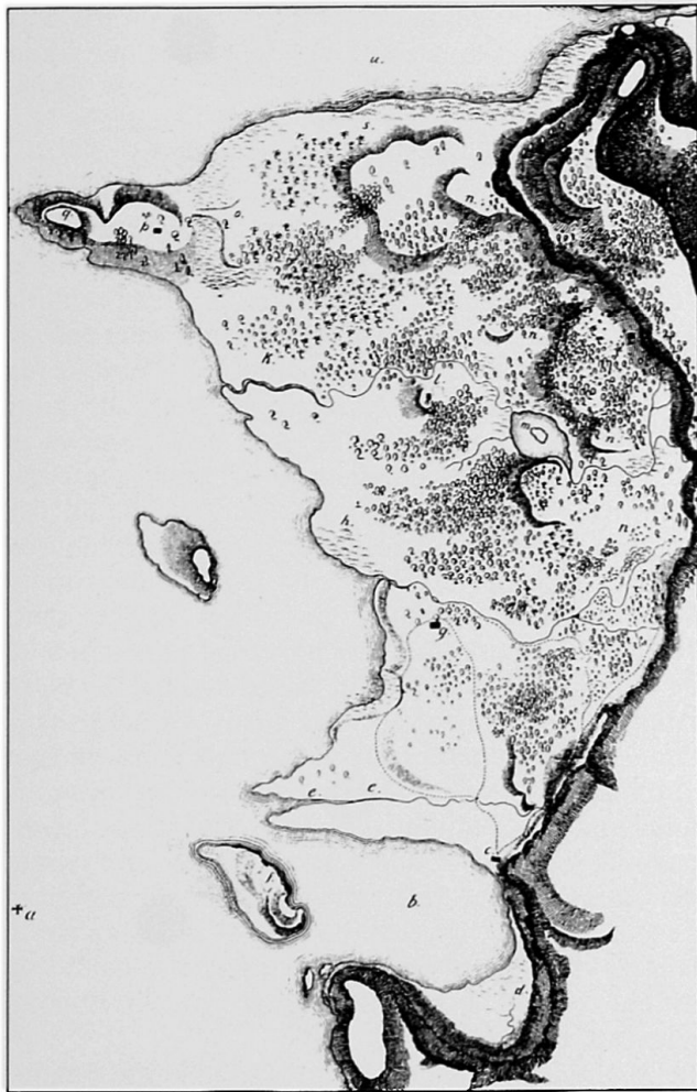
Fig.1 Carte de l'île d'après l'édition originale publiée à Zurich en 1813.