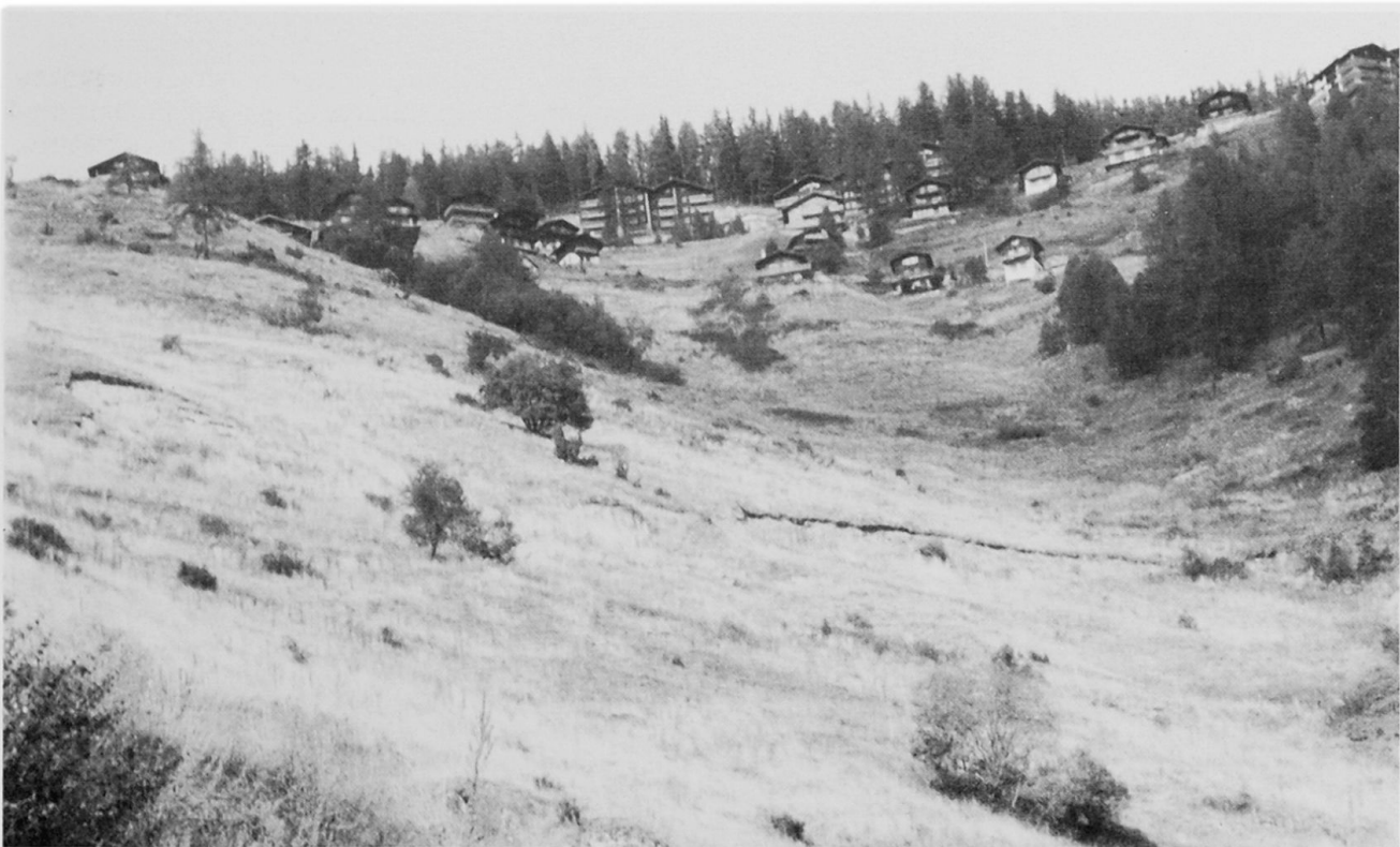
Noch ungelöstes Brachlandproblem in Chandolin, Val d'Anniviers.