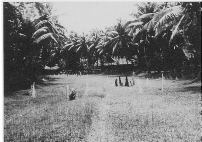
Abb.1 Tanz- und Kultplatz Kosimbi von Gaikorobi (Sawos), mit Kultsteinen und weißen Palmblättern in der Mitte; links im Hintergrund das Männerhaus, auf den seitlichen Längshügeln Kokospalmen.

Der Dorfgrundriß wird bei den Sawos, deren Dörfer nicht wie diejenigen der Iatmul auf Uferdämmen des Sepiks oder an Altwasser liegen und daher von der Topographie mitbestimmt werden, durch die langgestreckten Tanzplätze beherrscht. An den Seiten dieser Plätze ziehen sich die Längshügel hin, die meistens von Kokospalmen und Ziersträuchern bewachsen sind. An den Schmalseiten der Plätze stehen die Männerhäuser.