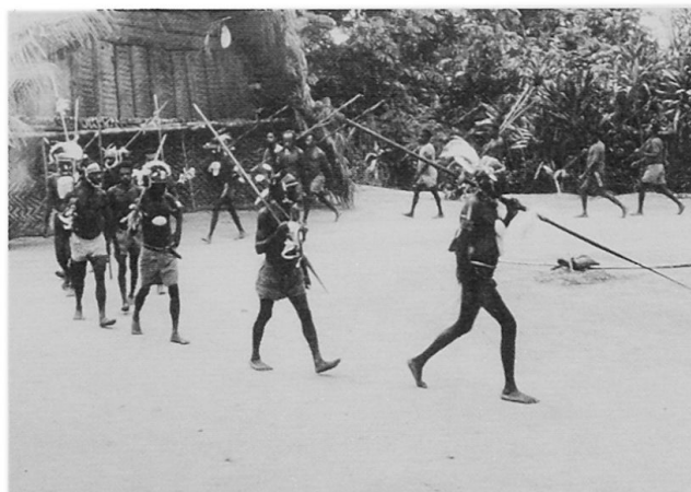
Abb. 2 Kultplatz in Mamsi (Bongos-Gebiet, Kwanga); Jäger tanzen um ein getötetes Tier (Wallaby), links im Hintergrund die Fassade des Kulthauses.

Zeremonien wieder verfällt. Auch andere Objekte, die mit dem Kult zusammenhängen, werden nicht für eine Dauer, als permanente äußere Erscheinung einer jenseitigen Wesenheit, angelegt. Das ist der Grund, warum man in Kwanga-Dörfern meistens keine kwaramba -Kulthäuser antrifft. Der Tanzplatz ( kondome ) wird während des Kultes zeitweise durch einen zusätzlichen Zaun abgegrenzt. Vor den Festen wird sämtliches Gras auf dem Platz entfernt. Die Sitzplätze für die Männer befinden sich auf den Seiten des Platzes.