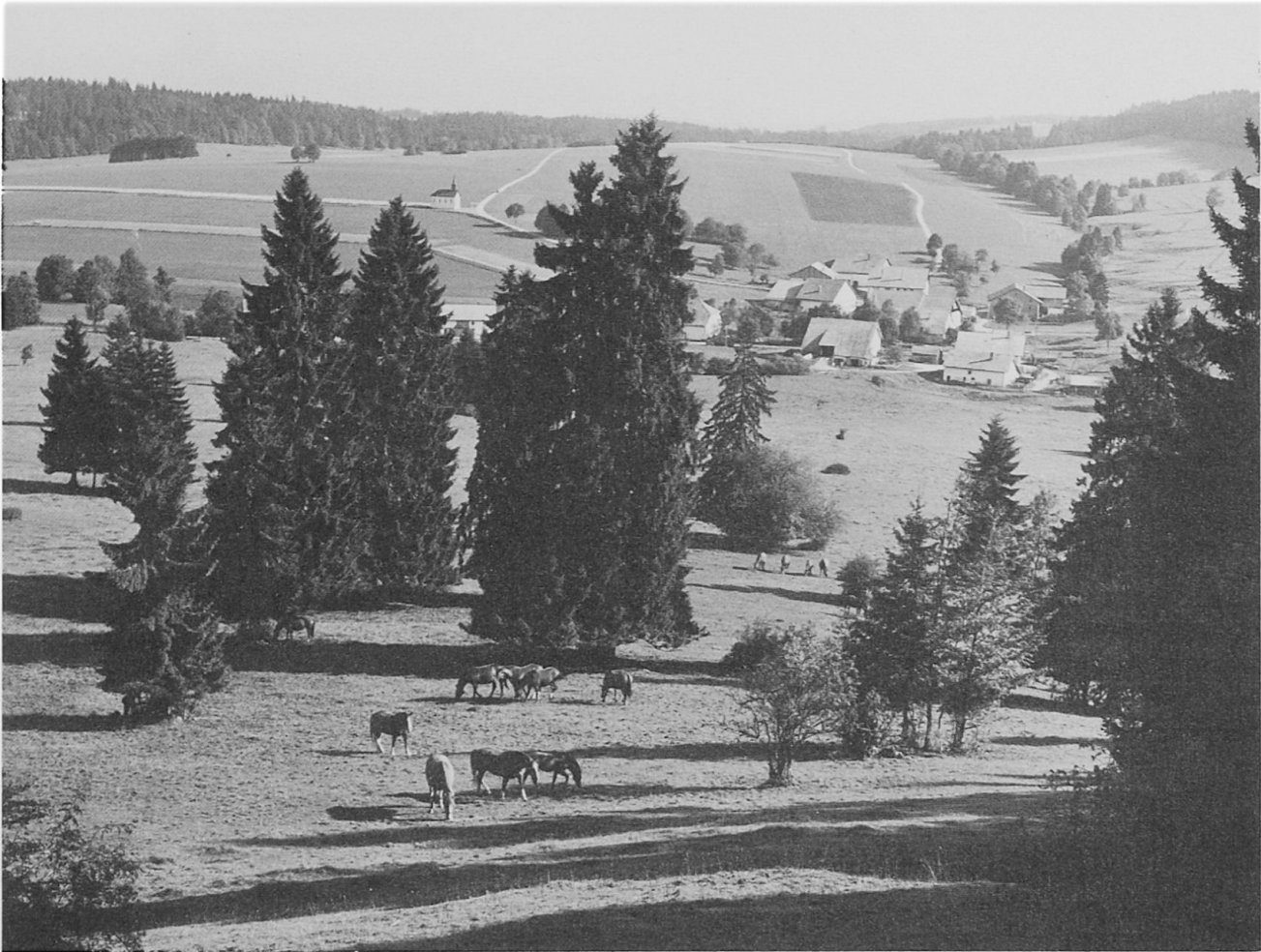
Les Franches-Montagnes (Jura).

Le canton de Neuchâtel par exemple a balisé toute une série d'itinéraires