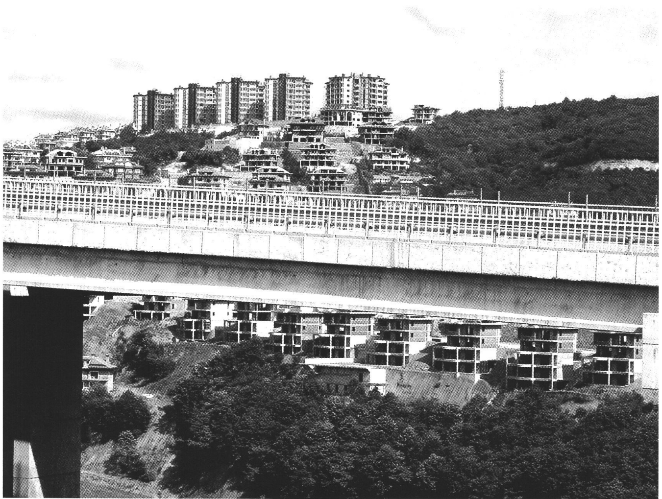
Photo 1: Les cités sécurisées d'Acarkent et de Beykoz Konaklari, avec le viaduc nouvellement construit, en juillet 2002

The gated communities Acarkent and Beykoz Konaklari, with the newly built viaduct, in July 2002