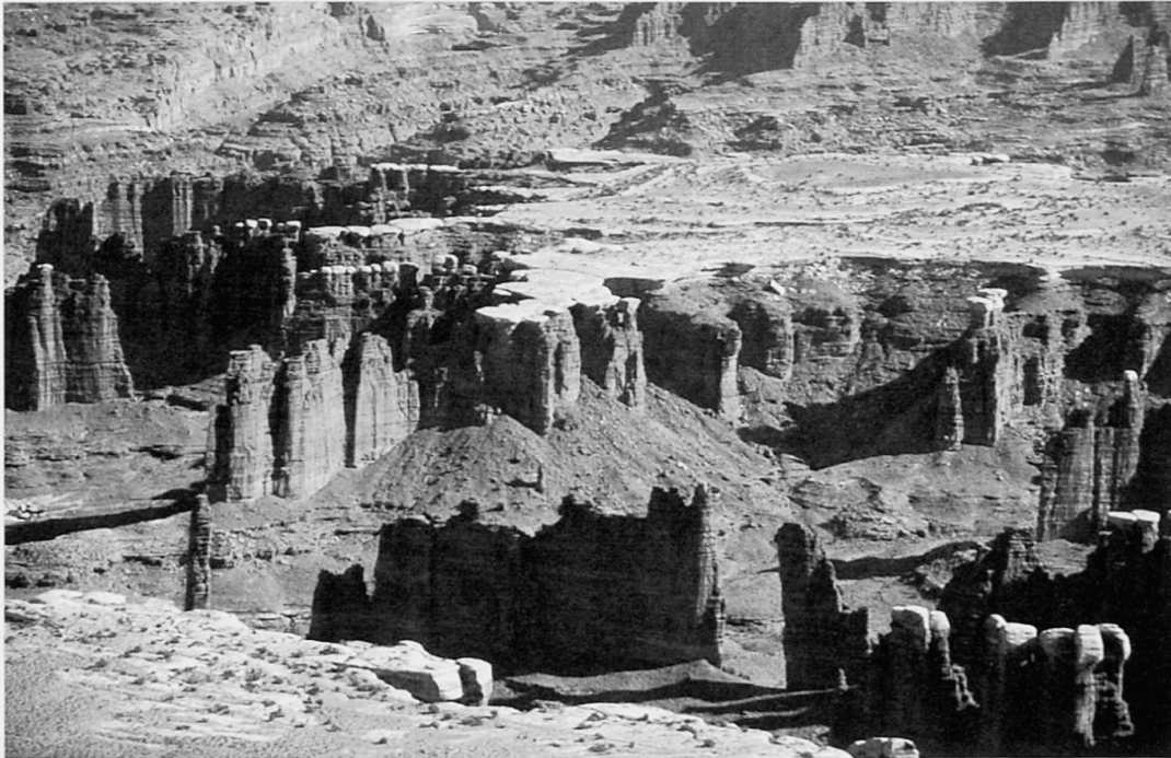
Foto 2: Erosionsformen im Canyonlands Nationalpark, Südost-Utah Rock erosion in Canyonlands Nationalpark, southeast Utah Formes d'érosion dans le Parc national du Canyonland, au sud-est de l'Utah