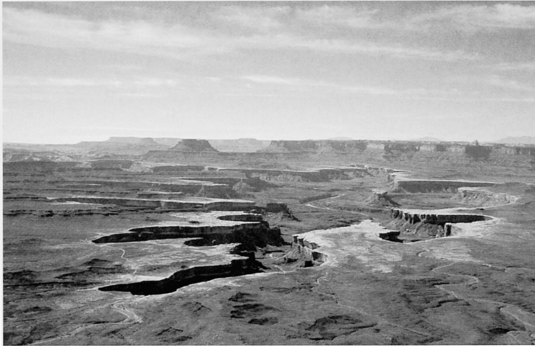
Foto 1: Blick auf den Greenriver im Canyonlands Nationalpark, Südost-Utah View of the Green River in Canyonlands Nationalpark, southeast Utah Vue sur Greenriver, dans le Parc national du Canyonland, au sud-est de l'Utah