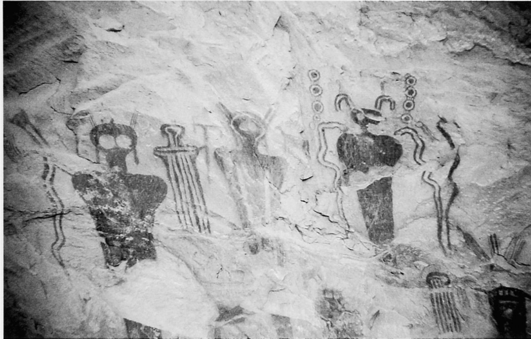
Foto 3: Piktogramme im Barrier Canyon-Stil in Thompson Wash, Grand County, Utah. Die «geistähnlichen» Figuren gelten als schamanische Elemente.

Barrier Canyon style pictograph panel at Thompson Wash, Grand County, Utah. The «ghost-like» figures represent shamanic spiritual elements.