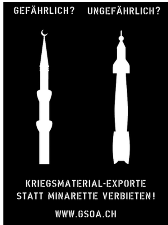
Abb. 3 und 4: Umdeutung ausserordentlicher Gefahrendiskurse

Contestation des discours d'insécurité extraordinaires