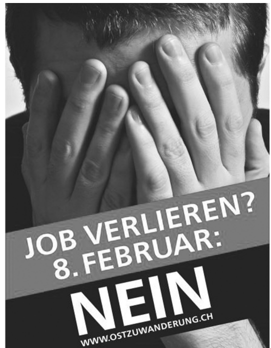
Abb. 1 und 2: Konstruktion von Bedrohungen durch Verknüpfung

Construction de menaces par association d'idées