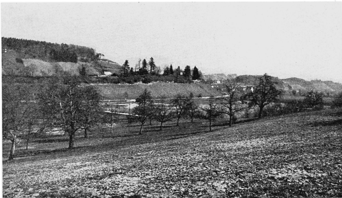
Abb. 1 Nagelfluhschichtterrassen bei Feldbach. Vordergrund: Schirmensee. Mittelgrund: Östliches Ende der zwei km langen Schichtterrasse, auf der die Bahnlinie von Uerikon nach Feldbach verläuft.

Verlauf der Gletscherunterfläche, das fließende Eis ausgedehnte Schichtterrassen herausmodelliert, daß aber dort, wo dies nicht der Fall ist, der Gletscher sich nicht stark um den Schichtverlauf kümmert, es vielleicht zur Ausbildung einer Schichtrippenlandschaft mit gerundeten Formen kommt und bei allzugroßen Abweichungen das Eis sich gänzlich unbekümmert um hart und weich seinen Weg bahnt.