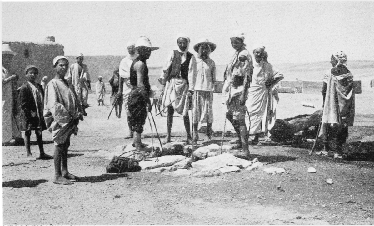
Brunnenreiniger an der Arbeit. Mit Seilen, Körben und Wassersäcken versehen, stehen sie um die Öffnung eines alten Brunnenschachtes.

höher gelegenen Gärten Einhalt zu gebieten. Es kam so in den Oasen des Oued Rhir in den letzten Jahrzehnten zu einem «Wandern» der Gärten von oben nach unten. Dennoch hat, im gesamten gesehen, die Wassermenge durch die neuen Bohrungen zugenommen und damit auch die Ausdehnung der Gärten. Heute zählt dieses Gebiet ungefähr 1 300 000 Palmen. Die Möglichkeiten zusätzlicher Wasserbeschaffung sind noch nicht erschöpft; nach Auskünften des Wasseramtes könnten allein dadurch, daß man die alten Brunnen ausbessern würde, noch weitere 100 000 Minutenliter gewonnen werden.