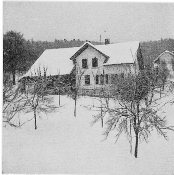
Fig. 4. Alter Wohnhaustyp: Arbeiterbauernhaus, erbaut um die Jahrhundertwende an Stelle eines Strohhauses. Kleine Scheune für 1 Kuh und 1 Rind. Umschwung wie in Fig. 3.

den Siedlungsphase an, deren Zeugen äußerlich noch in unsere Zeit hineinragen und Landwirtschaft dort vortäuschen, wo diese das Feld schon längst hat räumen müssen.