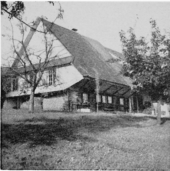
Fig. 3. Alter Wohnhaustyp: Aargauer Dreisäßenhaus, ein Bauernhaus mit mächtigem, tief unterhängenden Satteldach. Angebaute Scheune. Als Umschwung Wiesland mit Baumgarten nebst Kraut- und Ziergarten nächst dem Haus.